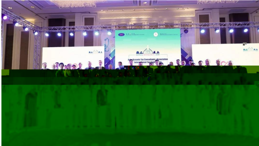
▲ 中税协代表团合影